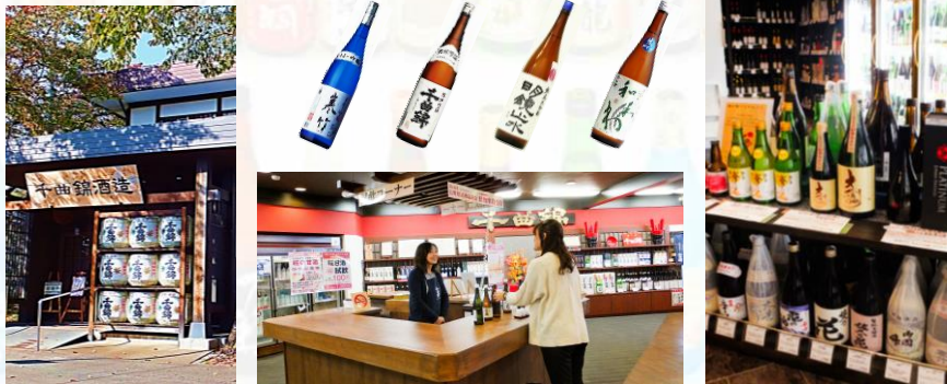
広いショップと、バーカウンターのような試飲コーナーがある「千曲錦酒造」

「明鏡止水」を醸す大澤酒造。美術館や酒の博物館も隣接しています。試飲できる酒蔵を主に訪問します。納得のいくお酒をお選びください。