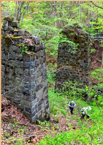
山中を歩き進むと、突然かつての橋梁の 橋脚が現れる(柳川橋梁跡)。

半世紀以上前、日本を代表する避暑地・軽井沢と、日本を代表する温泉地・草津温泉を、夢の高原列車が繋いでいました。それが草軽電気鉄道、略して「草軽電鉄」です。北軽井沢や嬬恋村三原はその舞台のまさに中心地でした。各所に存在している廃線跡と遺構をめぐります。一日たっぷり、草軽電鉄に思いを馳せてください。