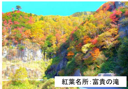
紅葉名所:富貴の滝