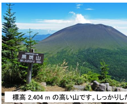
標高 2,404 m の高い山です。しっかりした登山の準備をしてください。

15:30 ホテル発の軽井沢駅行き 無料シャトルバスには間に合いません! 12日はご宿泊されることをお勧めします。