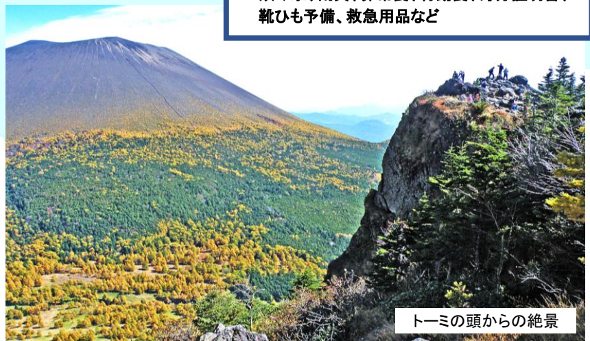
トーミの頭からの絶景

天高い秋。黒斑山登山のベストシーズンです! 浅間山近景のド迫力、トーミの頭の絶壁、その間に 広がる広大な湯の平盆地と火口地形。ダイナミック な風景に胸が打たれます。