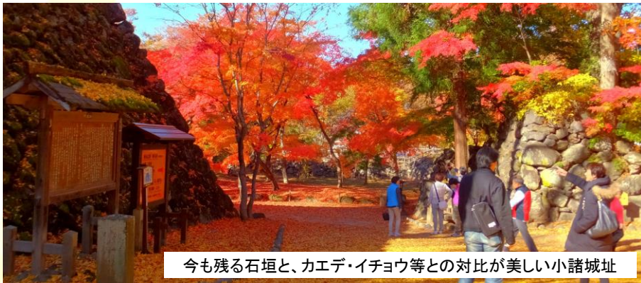
今も残る石垣と、カエデ・イチヨウ等との対比が美しい小諸城址

中世より幾多の名将が城主となり、歴史の表舞台にあった小諸城は、安土桃山時代から江戸時代にかけて、石垣を構築した近世城郭に改修されました。また城下町小諸宿は、現在でも所々に土蔵作りの家、格子のある商家など、宿場町の面影を残しています。石垣や木造建築と紅葉のコントラストをお楽しみください。