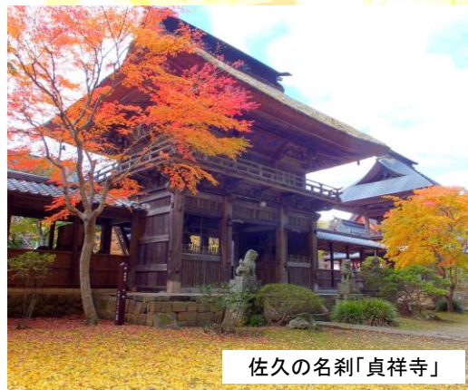
佐久の名刹「貞祥寺」