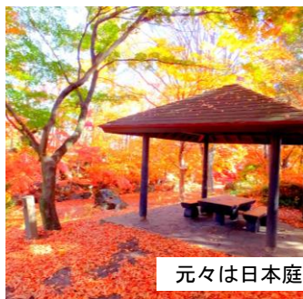
元々は日本庭園だった中嶋公園