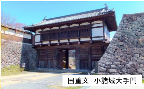
国重文 小諸城大手門